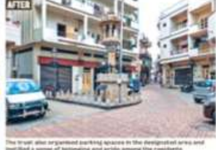
The trust also organised parking spaces in the designated area and invited a sense of belonging and pride among the residents

Amdavad Municipal Corporation and 7 others