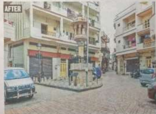
The trust also organised parking spaces in the designated area and instilled a sense of belonging and pride among the residents

pol to conduct heritage walk every year through the World Heritage Week.