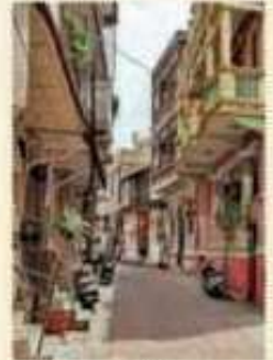
» ૨૦૨૧માં બ્લોક નખાયા

અમદાવાદની પોળોને જો આવી રીતે પુનઃ સ્થાપિત કરાય તો પોળો ટૂરિસ્ટ પ્લેસ બની શકે છે