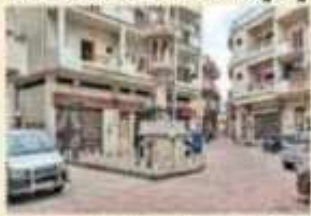
» ૨૦૨૧માં પાર્કિંગ વ્યવસ્થા કરી દેવાઈ