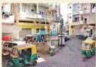
» ૨૦૧૭માં આડેધડ પાર્કિંગ થતું હતું

અભ્યાર સુધી અમદાવાદમાં આવેલા વિવિધ ડેરિટેજ સ્ટ્રક્ચરનું રિસ્ટોરેશન થતું હતું પરંતુ અમદાવાદમાં આ પ્રથમવાર એવું બન્યું છે કોઈ સ્ટ્રક્ચર કે ઈમારત નહીં પણ પોળમાં એક આખા એરિયાને જ રિસ્ટોર કરીને તેની તસવીર જ બદલી નાંખી હોય.