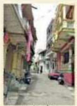
» ૨૦૧૭માં જગજિત રસ્તા

પોળમાં સૌથી મોટી સમસ્યા જગ્યાનો અભાવ હોય છે. તેમાં પણ પોળની અંદર પાર્કિંગ તો માથાના દુઃખાવા સમાન છે. પરંતુ મહિલા હાઉસિંગ ટ્રસ્ટ દ્વારા ઢાળની પોળમાં અશક્ય એવી પાર્કિંગ વ્યવસ્થા ઉભી કરીને અનોખું ઉદાહરણ આપ્યું છે. ઘરની બાજુના રસ્તાઓ વચ્ચે એક સેન્ટ્રલ લાઈન અને વ્હિકલ ગોઠવવાની પ્રદ્ધતિ શોધીને પાર્કિંગની સમસ્યાનું સમાધાન લાગ્યાં છે. પોળના તુટેલા રસ્તા પર બ્લોક ફીટ કરીને એક પાર્કિંગ એરિયા બનાવાયો છે.