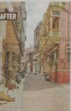
The MHT repaired building facades and heritage structures and modernised primary amenities for the residents here

Ahmedabad Mirror Bureau feedback@ahmedabadmirror.com